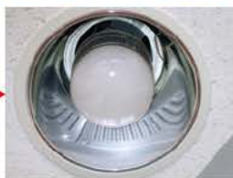
AD BigF III

ほとんどの高圧水銀ランプの口金は E39 型が採用されています。オーエスの AD BigF は E39 型口金のみで製品保持重量をクリアしていますので、ワイヤー等の補強工が必要なく、単純なランプ交換だけで即使用可能です。