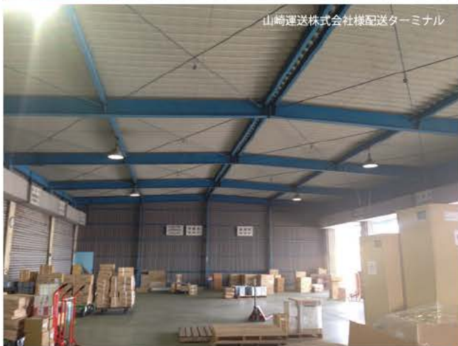
山崎運送株式会社様配送ターミナル