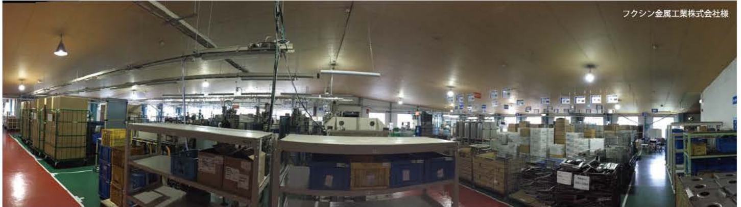
フクシン金属工業株式会社様