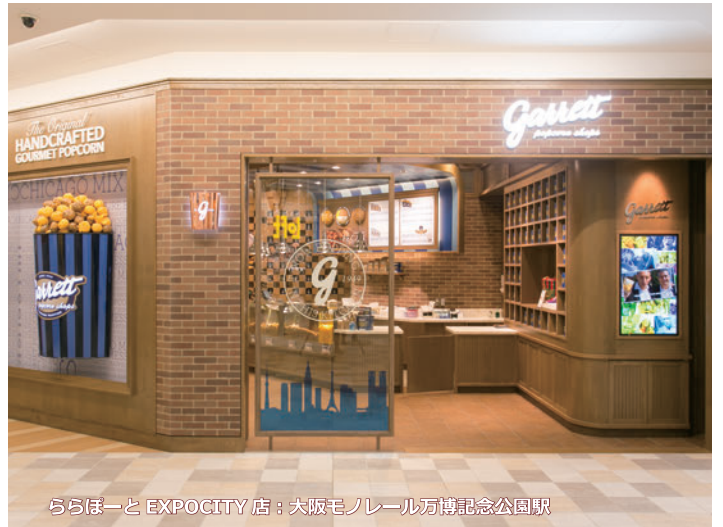
ららぽーと EXPOCITY 店：大阪モノレール万博記念公園駅

システム概要：46型マルチ用液晶ディスプレイ ×1台 セットトップボックス ×1台 壁掛け金具