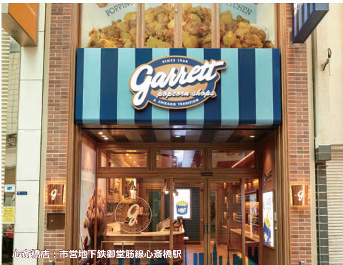
心齋橋店：市営地下鉄御堂筋線心齋橋駅

システム概要：52型液晶ディスプレイ ×1台 セットトップボックス ×1台 壁掛け金具