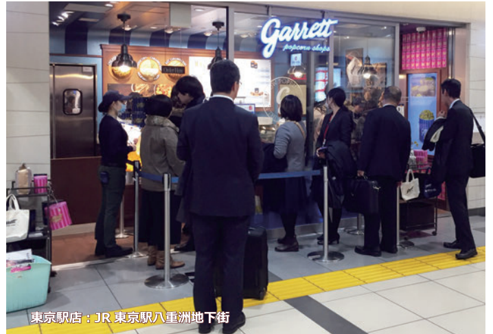
東京駅店：JR東京駅八重洲地下街

システム概要：60型マルチ用液晶ディスプレイ ×2台 セットトップボックス ×2台 大型マルチ用架台