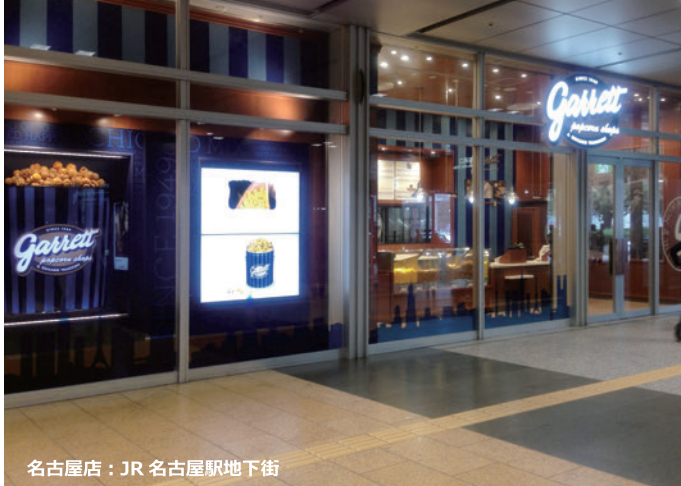
名古屋店：JR名古屋駅地下街

システム概要：60型マルチ用液晶ディスプレイ ×2台 セットトップボックス ×2台 大型マルチ用架台