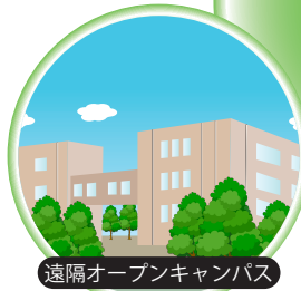
遠隔オープンキャンパス